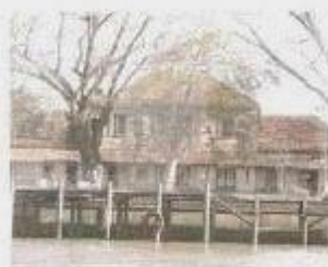
Imagen de la vieja estación ferroviaria; vista desde el Río Paraná.

13 de enero de 1876, cuando se produce el viaje inaugural con el primer tren que, partiendo de la Estación Central y con destino a Campana, traslada a bordo a autoridades nacionales y a presidentes de los directorios de los distintos ferrocarriles.