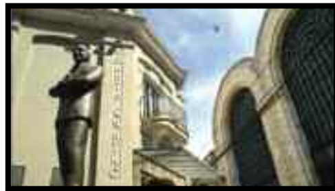
Imagen - Gentileza del Gobierno de la Ciudad de Buenos Aires

En 1776, Buenos Aires fue convertida en sede episcopal y capital del Virreinato del Río de la Plata por orden del Rey Carlos III de España, lo que la llevó a depender directamente de la corona de España hasta 1810, consiguiendo su independencia en 1816, al igual que el resto de Argentina.