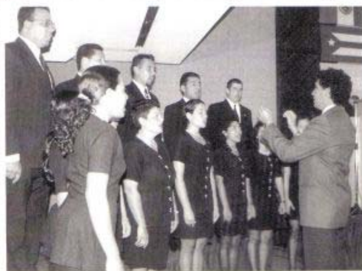
Actuación del Coro Polifónico

La isla Margarita fue el escenario elegido por la ASORESVEN para este encuentro. Está situada al norte del País más caribeño de Sudamérica, y fuera de la ruta de ciclones y huracanes: Junto a otras dos porciones insulares (Coche y Cabagua) conforman el Estado de Nueva Esparta, pero la mayoría la llama Isla Margarita, que al mismo tiempo es nombre de Perla y de Mujer. Posee 1.071 Km 2 de superficie, y se encuentra a tan solo unos kilómetros del continente, con un clima fresco y tropical que oscila entre los 28° y 30° centígrados. Para llegar se