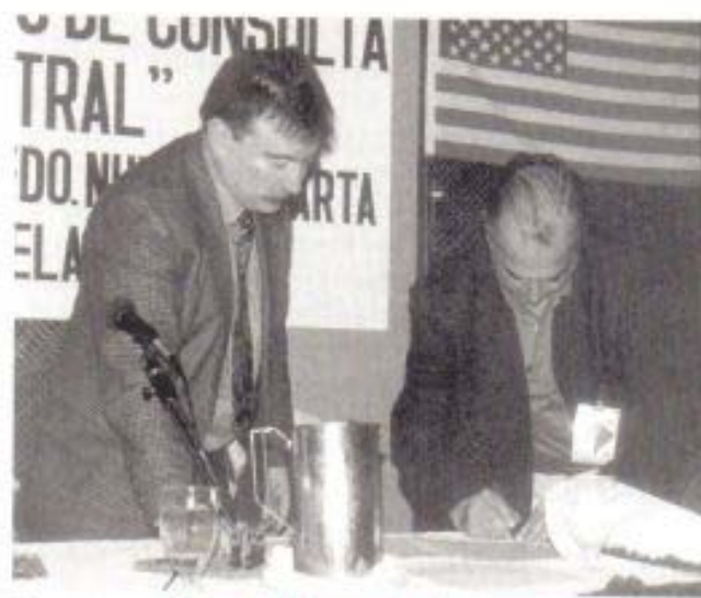
Firma del Convenio de Cooperación

El evento fue inaugurado por la señora Gobernadora del Estado de Nueva Esparta Dña. Irene Sáez, quién en su alocución manifestó que «es urgente la modernización de los Registros Públicos, la cual deberá venir acompañada de una adecuación y actualización de la legislación Venezol-