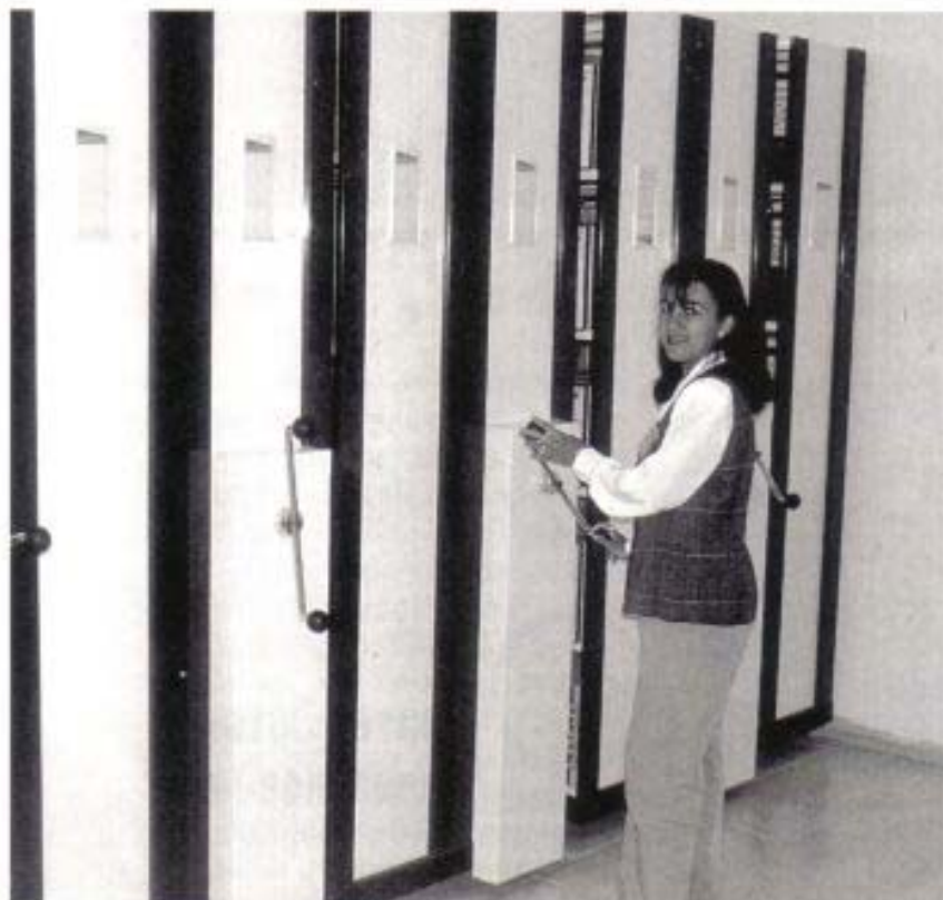
Vista del sector de archivos

de las prohibiciones para los inmuebles, embargos judiciales, etc. En el país hay prohibición para transmitir un bien que registre alguna medida cautelar, con lo cual se preserva el bien. Todas las inscripciones actualmente en este registro se hacen manualmente porque así lo determina la ley, pero a su vez lo hacen en forma electrónica preparándose la documentación para un futuro en que le ley permita hacerlo de esta manera únicamente.