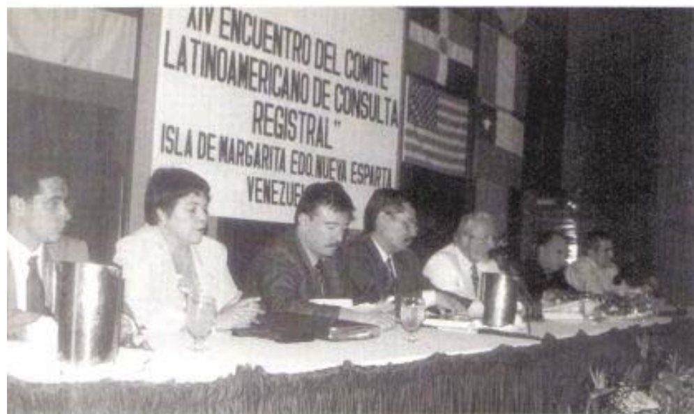
La Mesa Central del Encuentro, durante la inauguración del mismo

El Comité Latinoamericano de Consulta Registral es el espacio creado a fines del siglo XX por los Registradores de todos los países del área, interesados en reunirse e intercambiar las experiencias que cada uno vive en los diferentes registros, demostrando a veces hasta las diferencias propias de cada país.